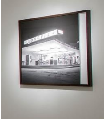
LONG VIE. 2015 Fotografía calada. 70 x 70 cm.