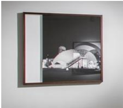
DUPERIAL. 2015 Fotografía calada. 70 x 70 cm.