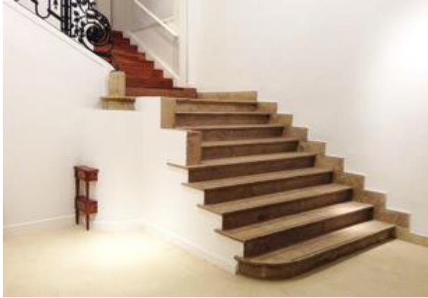
MESITA RETRAÍDA, mesita de luz Nordiska intervenida e instalada, 2015. $40.000

La artista ha sido invitada a participar en la Bienal del Mercosur 2015, a realizarse en Porto Alegre en octubre de este año, con dos piezas mobiliarias de su serie Bichos, en homenaje a la artista brasileña Lygia Clark.