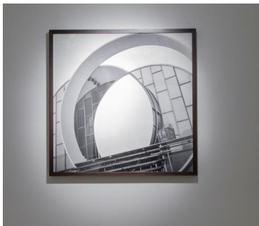
ROCADUR (JJ). 2015 Fotografía calada. 70 x 70 cm.