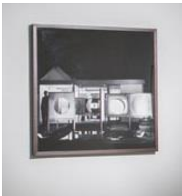
SEGURIDAD. 2015 Fotografía calada. 70 x 70 cm.